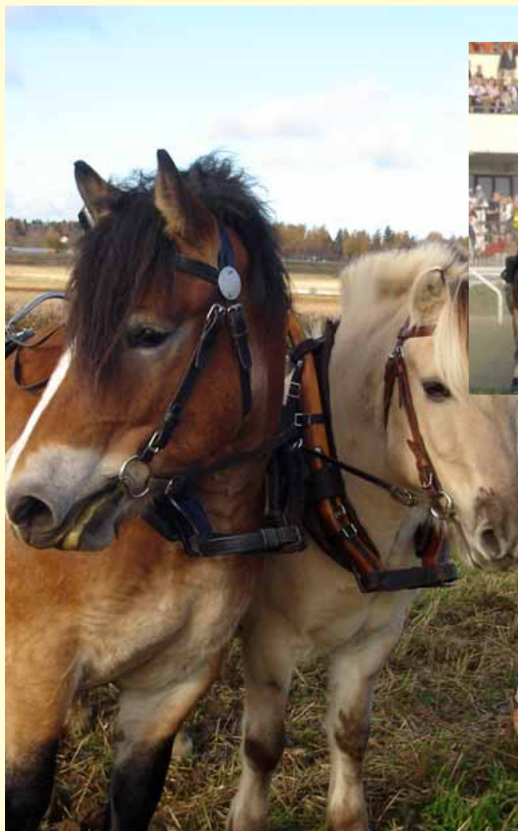
Kuskutbildning på Kvinnerstaskolan.