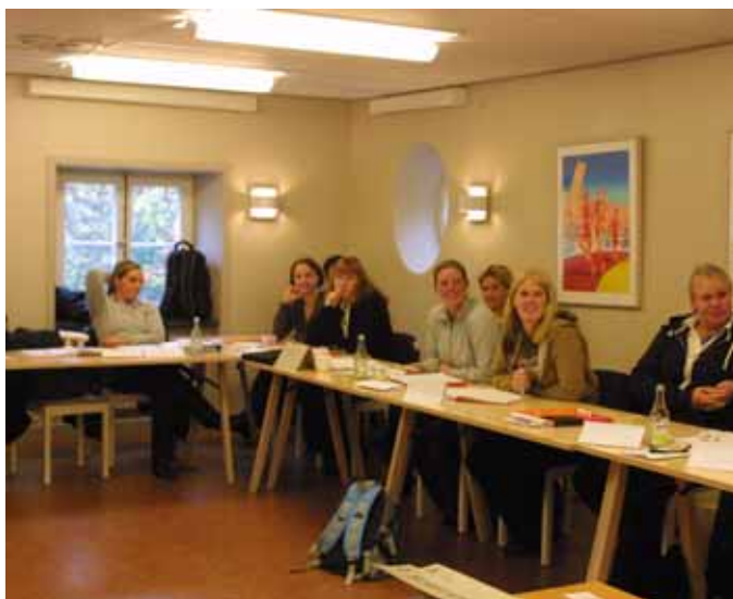
Många är de sätt man använt för kompetensutveckling i de olika projekten. Här har deltagarna i Ridsportens affärsskola lektion.

Materialet kommer att vara klart i början av 2008 och kurser kommer att arrangeras 2008 och delar av materialet kommer också att läggas ut på föreningens hemsida. Man har till viss del samarbetat med STC.