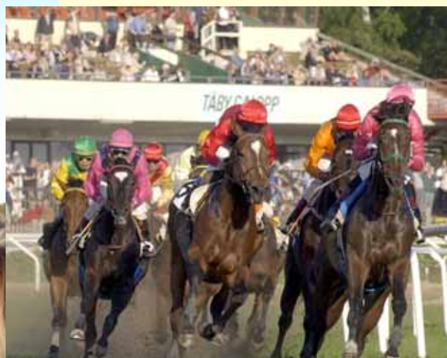
Löp på Täby Galopp.