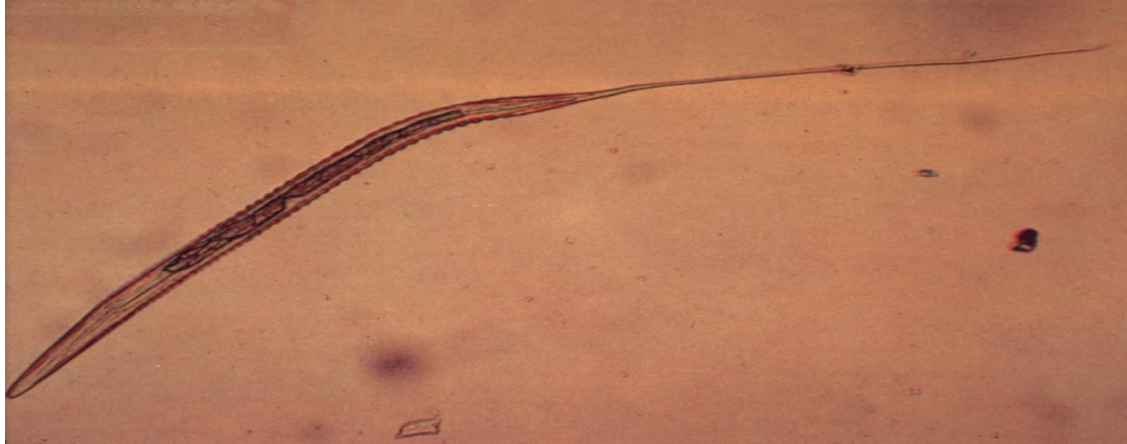
Figur 1. Cyathostominae i L3-larv stadium.