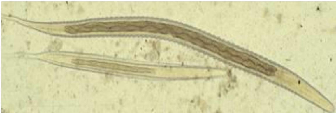
Figur 2. Överst på bilden visas Strongylus vulgaris och den undre är en Cyathostominae, bägge i det tredje larvala stadiet.

Prepatenstiden för S. vulgaris är omkring sex månader (Osterman Lind 2005)