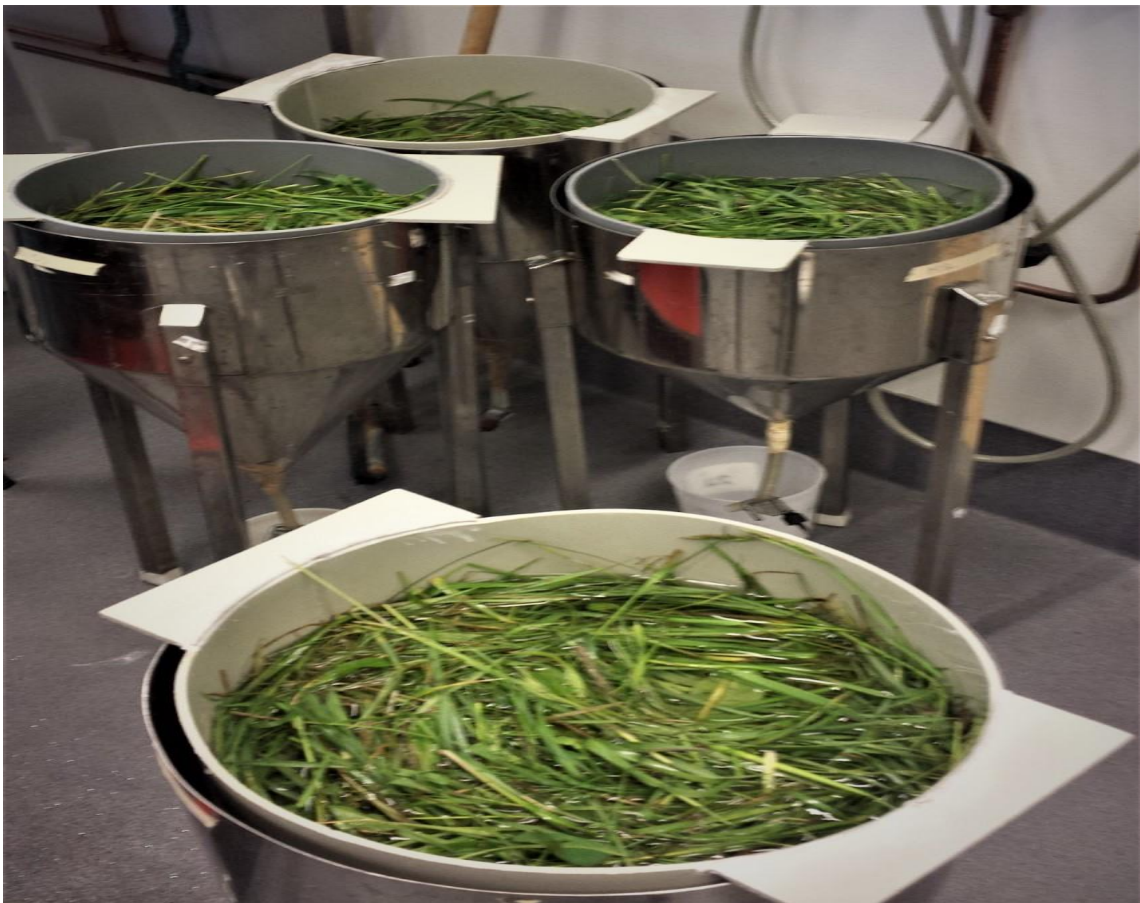
Figur 4. Gräsproverna preparerade i Baermann-trattar.

De insamlade gräsproverna vägdes och placerades i stor Baermann trätt av metall försedd med finmaskig sil, gummislang och slangklämma, se figur 4. Ljummet kranvatten tillsattes så att gräset täcktes av vattnet. Provpåsen sköljdes ur med ljummet kranvatten, så att allt insamlat material hamnade i silen. Gräset blandades och lämnades sedan att stå under ett dygn. Dagen efter tappades 45 milliliter vätska av i ett centrifugrör (Falconrör) genom att klämman runt gummislangen försiktigt öppnades. Rören med vätska centrifugerades i två minuter med 1000 revolutions per minute (rpm). Det översta skiktet sögs upp med en vätskesug. Fem milliliter vätska per prov mikroskoperades. Till hjälp vid mikroskoperingen användes Lugols jodlösning, en femprocentig jodlösning, för att avdöda och färga larver. Antalet L3-larver av blodmask i proven räknades. Gräset torkades i ett nät under två veckor och vägdes därefter. Slutligen kalkylerades antalet blodmasklarver per kilo betesgräs i torrsubstans för den mockade respektive omockade hagen.